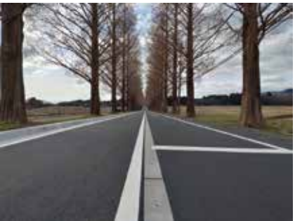
北牧野道路及び消雪設備改修工事完工