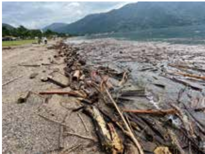
高木浜、知内浜、海津地域流木災害状況