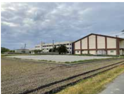
マキノ中学校プール解体工事完工