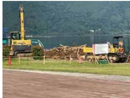
高木浜、知内浜、海津地域流木撤去作業