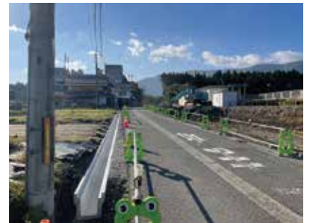
寺久保、石庭線道路拡幅工事着工