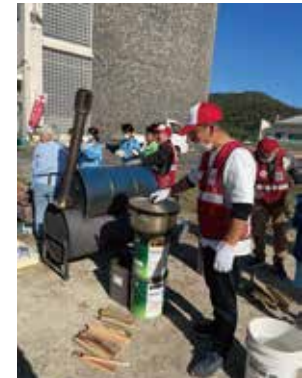
赤十字奉仕団活動