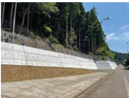
小荒路地域急傾斜地崩壊対策工事着工