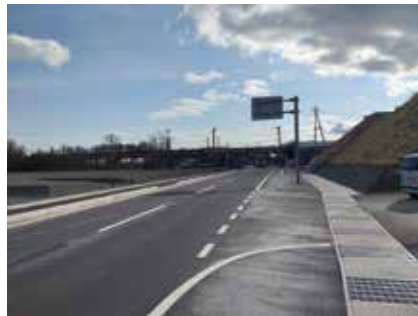
百瀬川隧道撤去工事完工