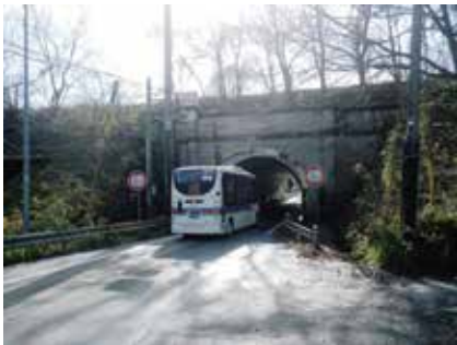
撤去前の百瀬川隧道