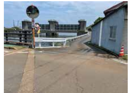
安曇川町四津川地先ガードレール移設工事完工