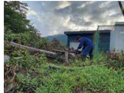
マキノ東小学校雑木撤去作業