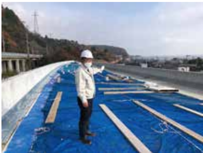
国道161号北小松エリア工事視察