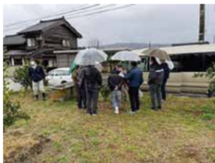
農業関係者視察研修