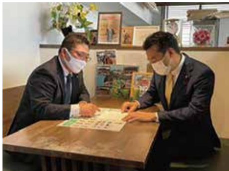
大岡としか環境副大臣と意見交換及び要望活動