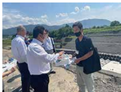
百瀬川工事現場視察