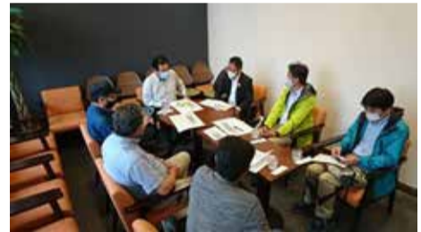
福井県議会議員及び敦賀市議会議員と意見交換