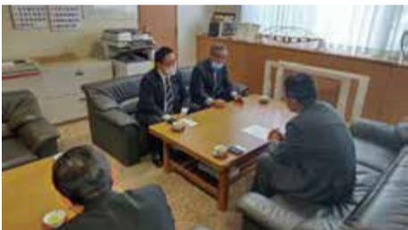
滋賀国道事務所へ要望活動