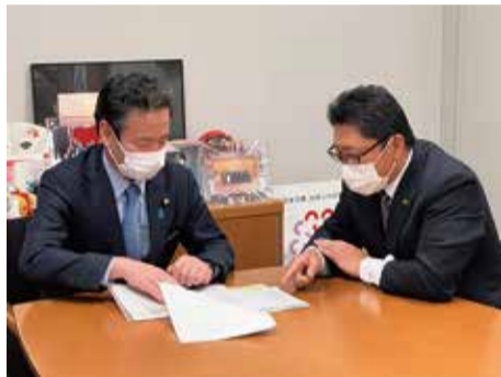
小籠たかし参議院議員と意見交換及び要望活動