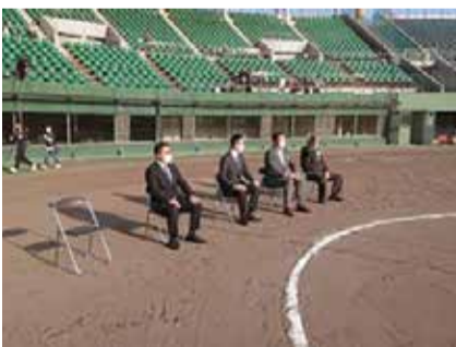
【第1回湖西杯】大津市・高島市スポーツ少年団野球大会閉会式に出席