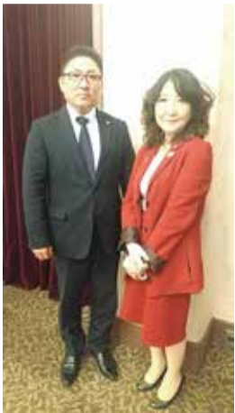
片山さつき参議院議員と意見交換