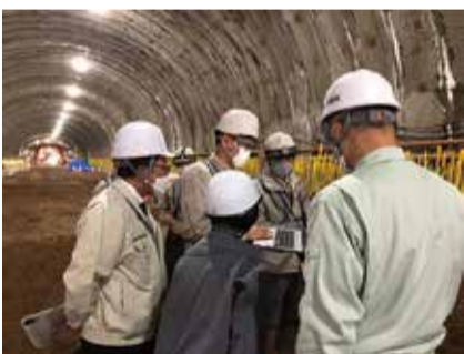
161号小松拡幅現場視察