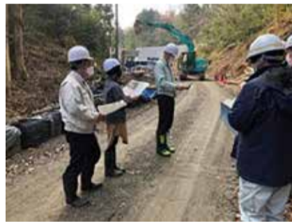
拝戸区災害現場視察