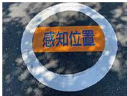
要望頂いた感応式信号感知位置表示