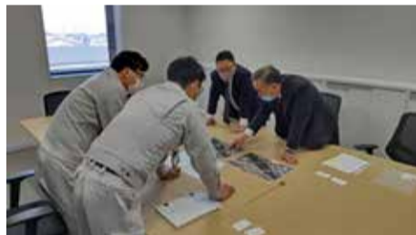
懸案事項に対して行政と協議