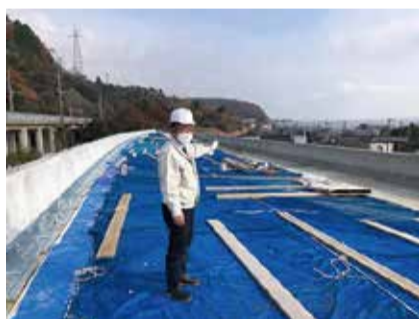
161号小松拡幅現場視察