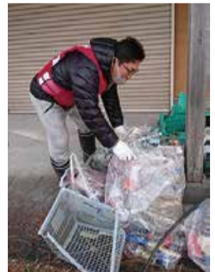
赤十字奉仕団活動